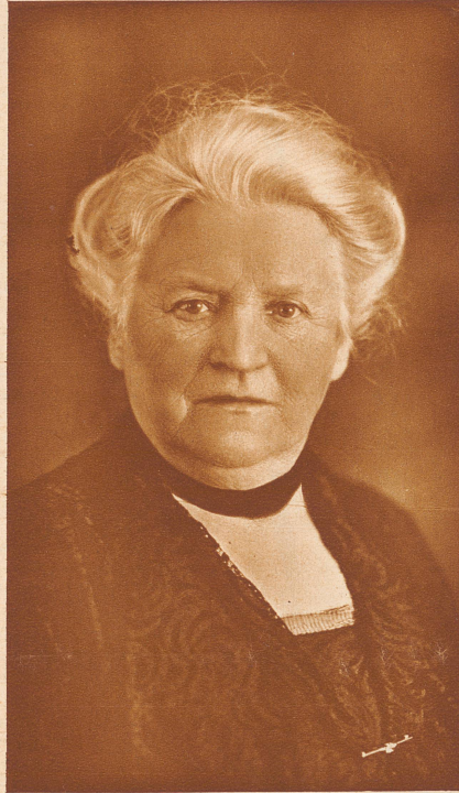
Am 28. November feiert

«Ich bitte, Frau Mutter, um Entschuldigung. Ich