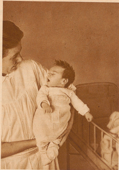
Pro Juventute 1931

Sofort machte sich Milecke auf den Weg. Endlich, hoffte er, würde nun die wahre Cowboyhistorie geschrieben werden!