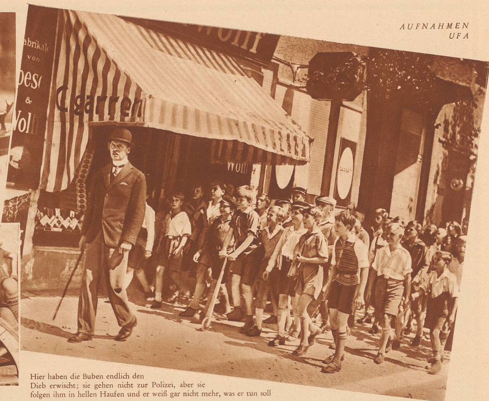
Hier haben die Buben endlich den Dieb erwischt; sie gehen nicht zur Polizei, aber sie folgen ihm in hellen Haufen und er weiß gar nicht mehr, was er tun soll