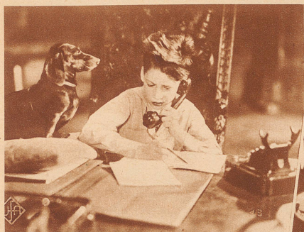
Einer, dessen Eltern ein Telefon haben, wird zur «Nachrichtenzentrale». Er freut sich ja nicht gerade, daß er immer zu Hause sitzen muß; aber sein Dackel leistet ihm Gesellschaft