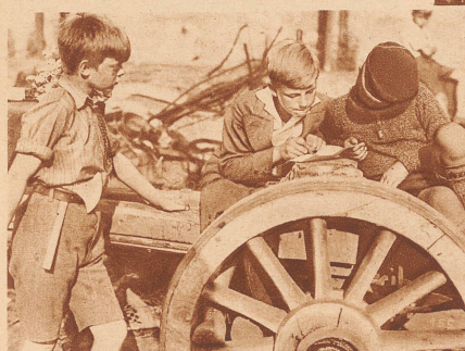
Der Kriegsplan! Der Oberleiter hat aufgezeichnet, welche Hotels bewacht werden müssen und erklärt es den anderen