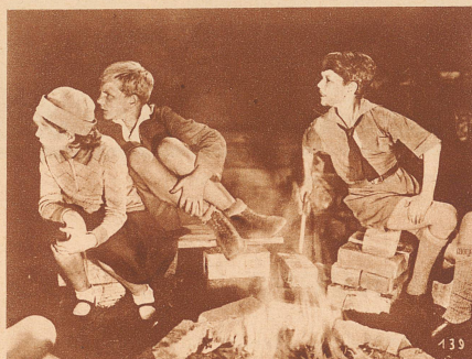
In dem Hof vom Hotel, in dem der Dieb wohnt, müssen ein paar Kinder immer Wache halten, damit er nicht entweichen kann. In der Nacht wird es kalt und sie machen ein kleines Feuer