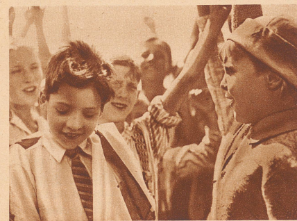
Die Kinder haben gesiegt!