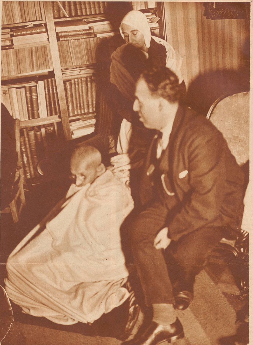
Gandhi im Hause Romain Rollands in Villeneuve

Ungeheures Aufsehen erregte in Deutschland und im Ausland die Tatsache, daß Adolf Hitler am 4. Dezember im Hotel «Kaiserhof» in Berlin für die englischen und amerikanischen Pressevertreter einen offiziellen Empfang veranstaltete, in dem er sie über das Verhalten seiner Partei zum Ausland bei der bevorstehenden Machtergreifung, an der er nicht mehr zu zweifeln scheint, informierte. — Hitler mit Hauptmann Goering