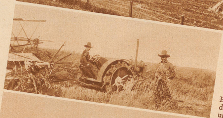
Beim Haferschneiden mit Traktor und Binder