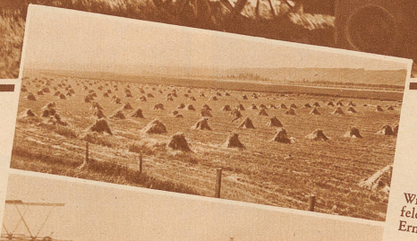
Wie ein Getreidefeld während der Ernte aussieht