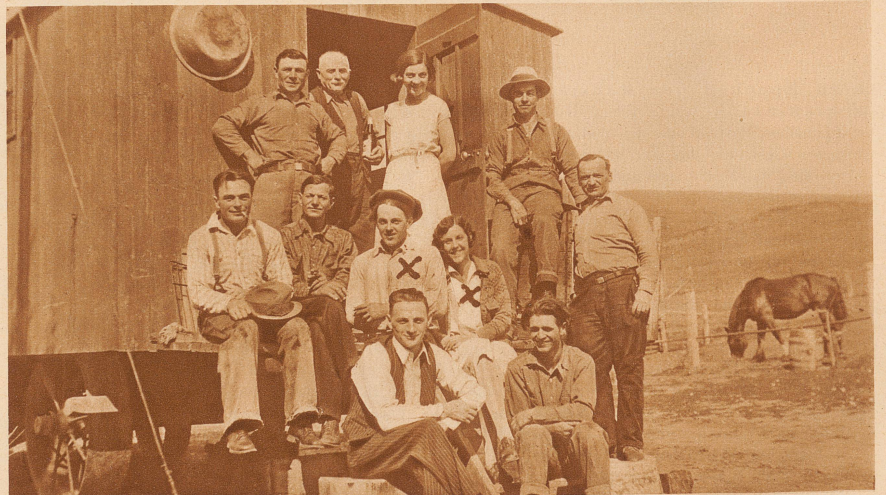
Nach dem Sonntagsdiner. Es scheint wohl geschmeckt zu haben, denn sehen nicht alle vergnügt aus? Der Besitzer, ein Schweizer, steht unter der Tür, neben ihm die Köchin, eine Zürcherin, die bis vor kurzem noch im «Blauen Seidenhof» in Zürich ihre Gäste bediente. Vor ihr x x Sohn und Tochter des Besitzers — si chönn na ganz guet Züridütsch!