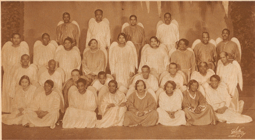
«Der himmlische Chor». Das Negerstück «The Green Pastures» (Die grüne Weide) hat in Amerika nicht nur bei der Negerbevölkerung von New York und Chicago, sondern auch bei den «upper ten» einen unerhörten Erfolg davongetragen; 700 mal wurde es von Negerchauspielern allein in New York gespielt. Das Stück schildert den unterdrückten, armen Negern Amerikas die Freuden des christlichen Paradieses mit einer solchen naiven Ueberzeugung und Glut, daß man an die Visionen der ersten Christen denken muß

Schon auf der Heimreise war er wiederholt aus- gefragt und neben dem Schlitten hergestapft, hatte zur Eile getrieben, laut mit sich gesprochen, Vor- würfe gegen sich gehäuft und mit der Faust gegen seine Stirn geschlagen.