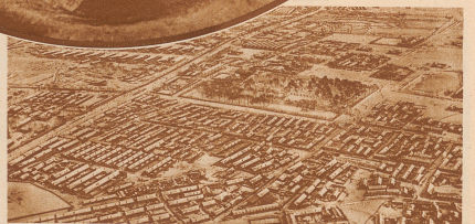
Das gewaltige Militärlager der Japaner außerhalb von Mukden - angeblich, erpönt, aufgeführt während der Verhandlungen vor dem Völkerbund in Genf und Paris - glänzt da noch jemand, daß die Japaner je wieder aus der Mandchurei herauszugetrieben werden?

Kühle Gebirge nördlich von Mukden, in der Mitte ein Gebirge, das die Flüsse trennt einem am Apparat fest. Sie haben's gut, Sie küssen sich und das Redaktionszimmer drüben, schreibt uns Herr Bosshard. - Nun muß man wissen, daß Bosshard alle seine Aufnahmen selbst entwickelt, immer gleich in drei Minuten nach dem Aufnahmestellen, oft unter ungünstigen Umständen.