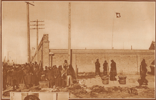
Die Mauer der römisch-katholischen Mission in Tsitsikar. Links die französische Pflegsunter dem Schutz die Mission mehr. Rechts die Schweizerfahne, die darin flattert, das die Leiter der Mission Schweizer ist. Im Vordergrund mandschurische Händler. Die Mission wurde gleich zu Beginn der japanischen Besetzung gekümmert und in ein Lazarett verwandelt. Zur Zeit sind in der Mission mehr als tausend japanische und chinesische Verwundete untergebracht.

Tsitsikar, auf dem linken Neuanfuhr, Gabelungspunkt der ostchinesischen Bahn, Hauptstadt der Provinz Heilingsiang, 85 000 Einwohner, Markt für Getreide, Backen, Felle, Fische, Künder, Pferde. Tsitsikar ist heute von den Japanern besetzt. Panzerzüge am Bahnhof, Infanteriekolonnen in den Straßen, Kavalleriepatrouillen überall - aufgeschauertes Leben strömt auch um die hohen Mauern der Niederlassung Tsitsikar des katholischen Missionshauses Bethlehem in Immense, darüber im mandschurischen Winterwind die Fahne unseres Vaterlands flattert.