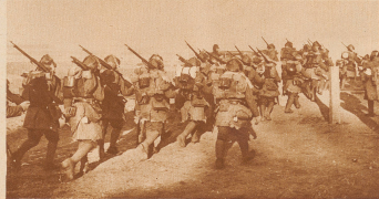
Japanische Infanterie rückt in Tsitsikar ein. Der mandschurische Winter ist streng, trocken und fast schneefrei. Temperaturen bis zu 30 Grad unter Null sind in den Monaten Dezember bis März keine Seltenheit. Dem entsprechend sind die japanischen Truppen sehr sorgfältig für diesen Winterfeldzug ausgerüstet.