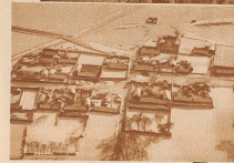
Verstecktes mandschurisches Dorf vom Flugzeug aus