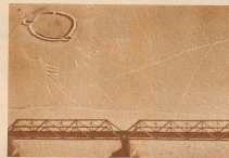
Eisenbahnbrücke mit kleiner Befestigung von Banditen in der Nähe von Charkow. Wir überfliegen viele Banditenlager und Nester, oft rechteckige Banditenhöhlen, die von anderen Dörfern sich von oben und unten durch Graben gut nicht untersuchen. Wir haben uns aber immer in reprobierter Höhe, um keine Gräbe aus Gewachsläden aus der Tiefe zu erhalten.