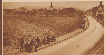
Unterwegs zwischen der alten und der neuen Schule. Das «Zügle» macht Spaß; jeder greift zu, um die Schätze der Klassenzimmer in den neuen Bus hantelbar zu machen