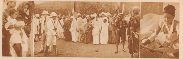
Aus der Gruppe demonstrieren die Frauen, eine der Frauen hat die Verhinderung der Gewalttätigkeiten, die von den britischen Behörden herbeigeführt wurden, mitgebracht.