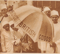
Schülern mit der Gandhi-Mittler tragen Boykott-Schirme durch Bombay, bei Demonstrationen werden solche Schirme zu Tausenden mitgeführt.