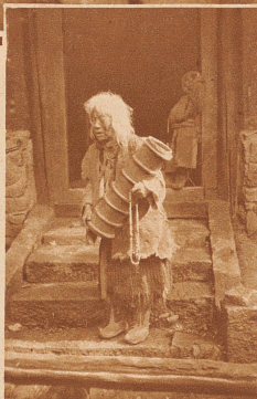
80jährige Klosterfrau mit ihrem Holzgefäß, in welchem Buttertee hergestellt wird