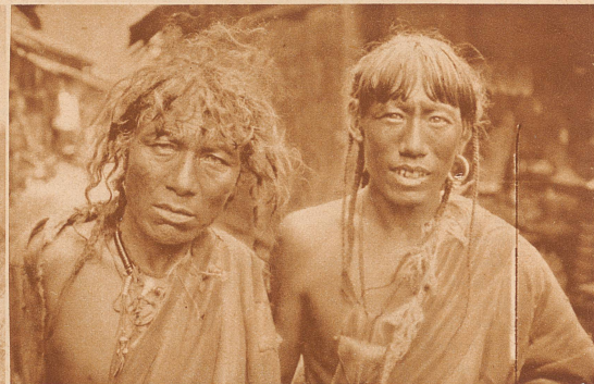
Tibetische Karawanen-Männer auf dem chinesischen Markt in Tatsicula, Ende November