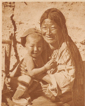
Nyarong-Mutter in der Wintersonne, das Kind im Sonnenbad bei einer Schattentemperatur von - 15 Grad C. Die Frauen dieses tibetischen Stammes tragen ihr Haar in über 50 dünnen hängenden, mit ranziger Butter eingesmienten Zöpfen

gen der Pariserin David-Neel, die 14 Jahre lang unter ihnen lebte, und auch die geistige Schulung in der Einsamkeit in Telepathie, vom Willen abhängige Regulierung des Herzschlages, der Körpertemperatur, und dergleichen studieren konnte. • Dem Durchreisenden in Chinesisch-Tibet oder Kam fallen schon an der Pforte von Tatsienlu die