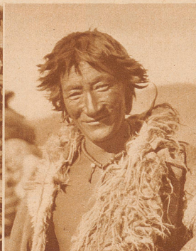
Tibeter beim Lager in Litang, der fröhlich lachend den Fremdling mustert