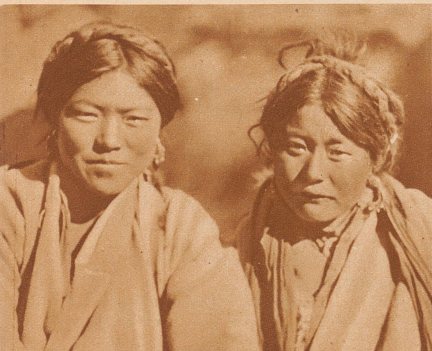
Rotwangige Hirtenmädchen aus Ost-Tibet, die wie die Männer auf Karawanenreisen die Yaks über die vereisten Hochpässe treiben