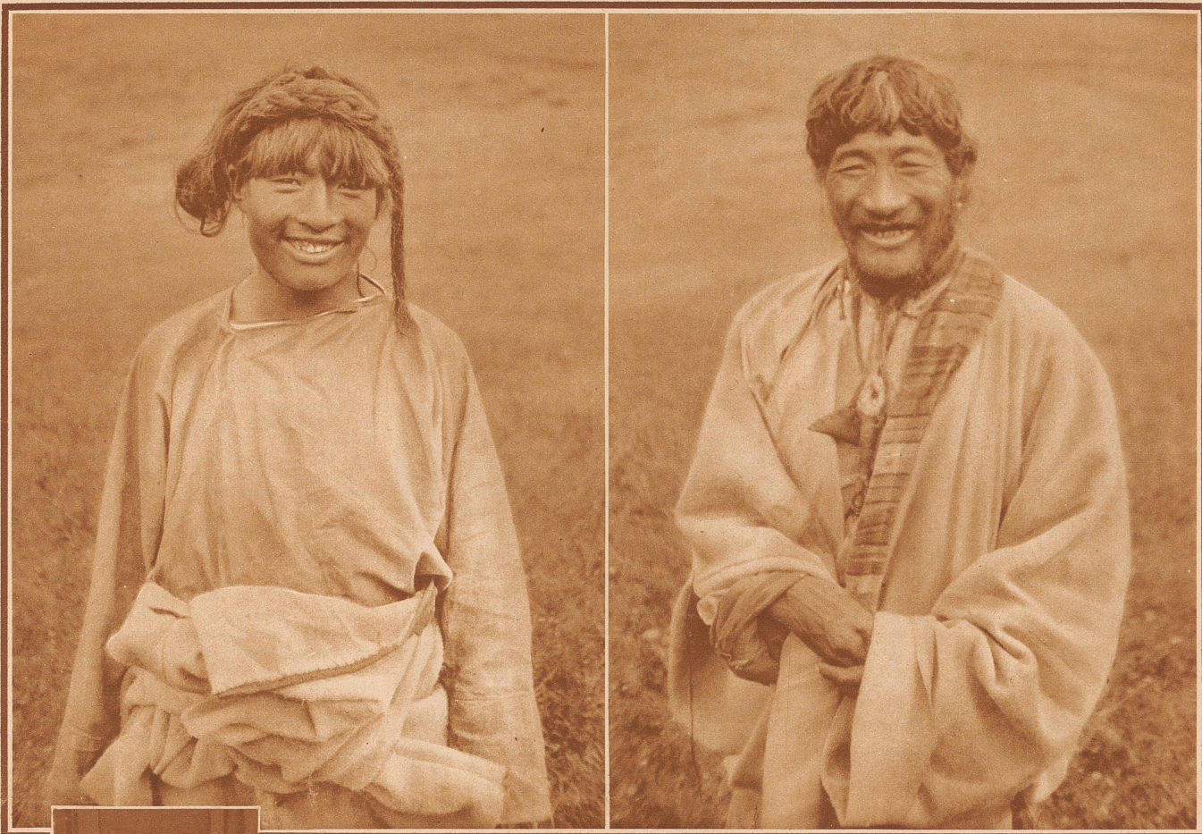
Freundliche Hirten auf einem blumigen Hochalpental von 4200 Meter