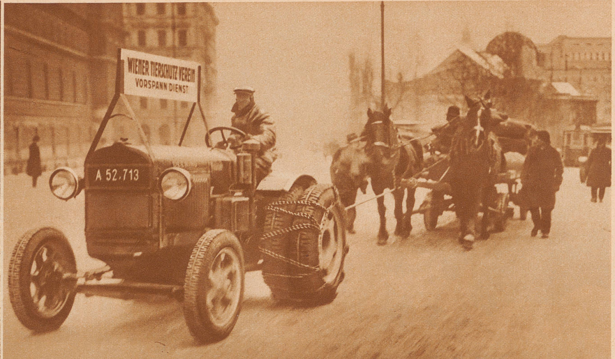
Winterhilfe für die Pferde. Die Wiener Tierschutzorganisation ist besonders gut ausgebaut und leistet wirksame Hilfe; in den letzten kalten Wochen hat sie die gute Idee gehabt, Fuhrwerksbesitzern unentgeltlich Traktoren für den Vorspanndienst zur Verfügung zu stellen, um den Pferden das schwere Ziehen auf den vereisten Straßen zu erleichtern