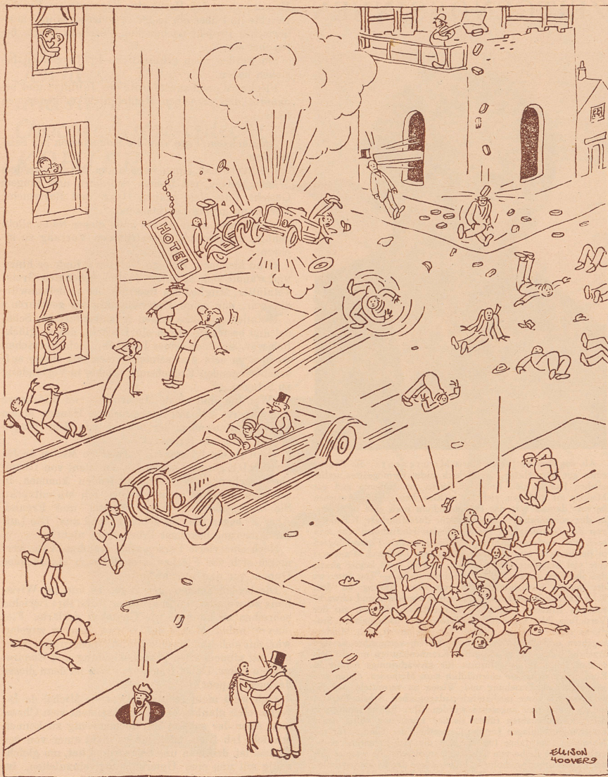
Wie sich ein Jurist das Paradies vorstellt!