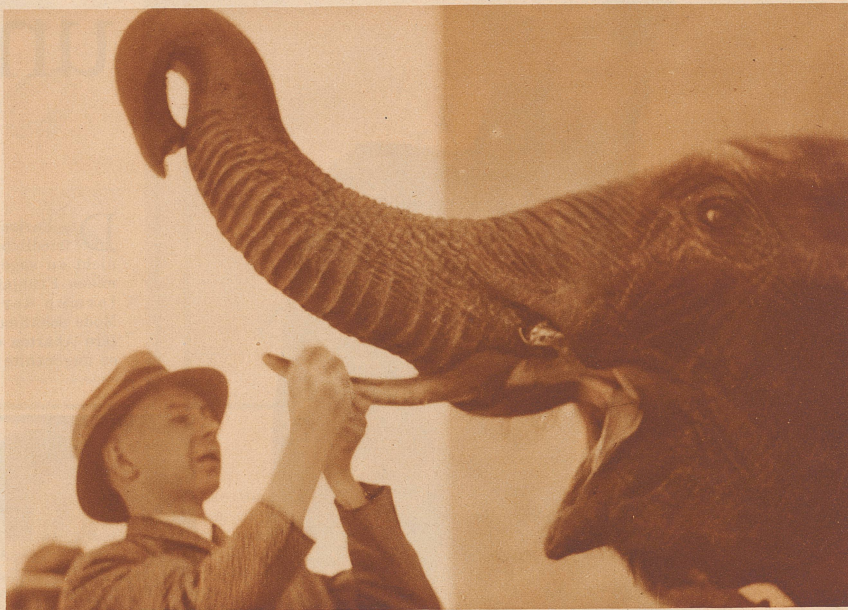
Der arme Chang hat nur noch einen einzigen Elfenbeinzahn, der andere ist abgebrochen, als Mandjula den Chang in einen Graben warf. Der Zahn wird in fünf Jahren wieder ziemlich nachgewachsen sein