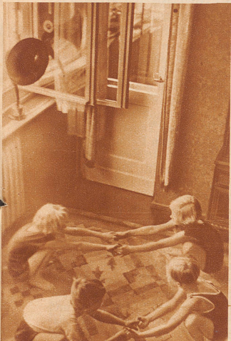
Alle machen mit!

Sie packen sich an den Händen, verankern die Füße fest auf dem Boden und reißen sich gegenseitig mit aller Macht nach vor- und rückwärts. Aber umfallen gilt nicht!