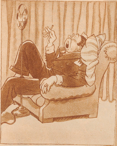
Der Gymnastiklehrer im Senderaum (um 6 Uhr früh!):

«Rumpf beugen . . . . eins, zwei, . . . . eins . . . . zwei . . . . tiefer, bitte! . . . . Nicht so bequem sein!» (Aus der «Berliner Illustrierten»)