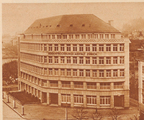
Das neue Gebäude der Seidentrocknungs-Anstalt von Zürich wurde kürzlich eingeweiht und dem Betrieb übergeben. Die Zürcher Seidentrocknungs-Anstalt ist weltbekannt und steht zuvorderst in den Umsatzziffern im Weltaidenhandel