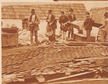
Das Wasser steigt immer höher. Die Menschen retten sich vor der einbrechenden Flut mit ihrer Habe auf die Dächer