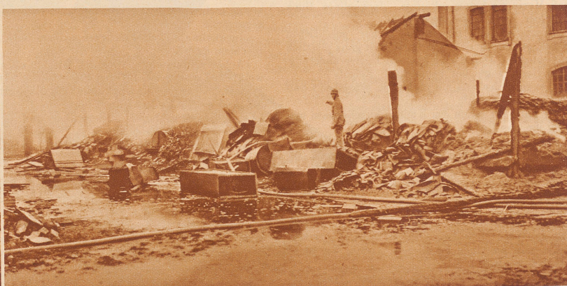
Großfeuer in Giubiasco. In der Nacht vom 23. zum 24. April 1932 brach in der Linoleum-Fabrik Giubiasco ein Brand aus, durch den das Magazinegebäude für Linoleum-Abfälle gänzlich zerstört wurde. Der Materialschaden ist bedeutend; der Fabrikationsbetrieb erleidet keine Unterbrechung