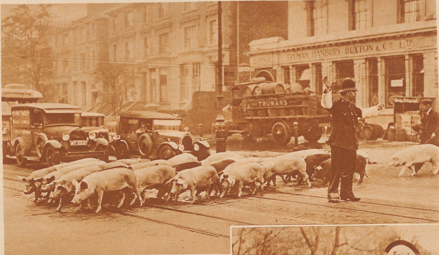
Der Verkehr wird gestoppt, — damit eine Ferkelherde sicher über die Straße kann

vollmelken. Da gibt es ein lustiges Durcheinander von Ziegen, deren Glocken läuten und Trams, deren Glocken auch läuten, und wenn zwei solche läutende Wesen aufeinanderstoßen, dann muß sicher das Tram nachgeben und warten, bis es der Ziege gefällig ist, auf das Trottoir zu hüpfen. — Für die Kinder aber, die in den großen Städten ja oft auf der Straße zu Hause sind, haben die städtischen Beamten viele Schutzmaßnahmen ausgedacht; viele Straßen gehören den Kindern ganz, das sind die Spielstraßen, auf denen keine Fahrzeuge fahren dürfen. An anderen aber leuchtet schon von weitem ein Schild: «Achtung, SCHULE, während den Pausen keine Durchfahrt.» Die schwierigen Verkehrsregeln und die Bedeutung aller Verkehrszeichen werden schon in der Schule gelehrt und oft gehen ganze Klassen mit ihrem Lehrer zusammen auf die Straßen, mitten in den dicksten Verkehr, um zu probie-