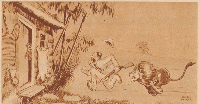
«Sambo! Schnell, mach auf! Den bring ich lebendig mit!»

«Alles, was ich für Sie tun kann», erwiderte Mellon, «ist dieses: nennen Sie mir die drei übrigen Angestellten, und ich setze sie noch heute an die Luft!»