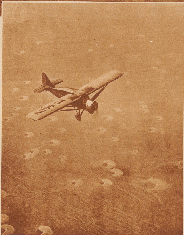
Vom Flugzeug aus sind die Wanderdünen in ganzen «Rudeln» wahrnehmbar

Die Yoga-Steppe wird von eigentümlich mondsichelförmigen Gebilden durchwandert, von Sanddünen, die sich unter dem Druck des ständig gleichen Windes innert Jahresfrist um 20 Meter fortbewegen. Unser Bild vermittelt einen Begriff von den Ausmaßen einer solchen Wanderdüne