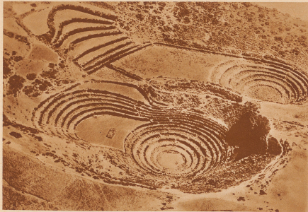
Zwei schöne, schalenförmige, amphitheatrische Bodenmolen, wo sich die Chimú oder die Inkas zum Getreidebau versammelten. Diese Ueberreste einer hohen Kultur sind noch in der Weise erhalten geblieben; in keinem einzigen der sich mit der Vorgeschichte Perus befassenden Bücher werden sie erwähnt

bedeutenden Wert solcher Photos für geographische oder archäologische Expeditionen. — Die Peru-Expedition gibt von einem großen Stück Erdoberfläche, das eigentlich auf der Landkarte bis heute noch als weiße Leere erscheinen müsste, klare Uebersicht