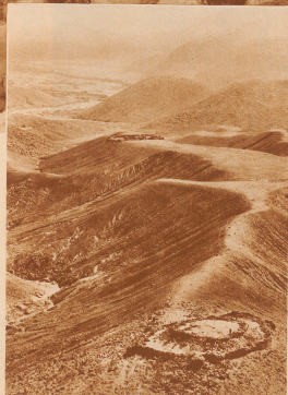
Das interessanteste Erlebnis für die Flieger war die unvermerkte Schau auf ein Bauwerk, das sich gleich der Chinesischen Mauer in gewaltiger Länge und in einer Höhe von fast 4000 Meter über Meer erstreckt und das in breiter und von den Fliegern in einer Ausdehnung von 50 km überblickt wurde. Tief lagende Wolken verunmöglichten den Forschern, die ganze Länge dieser Verteidigungswand festzustellen. Der Wall wurde vermutlich von den Chimú erstellt. Er hält sich in seinem Richtungswinkel an die kaum ausgetrocknete Bert eines Nebelsummes der Santa Inca. Die weite und wohl auch zerstückelt übergehende seiner Erbauung bezeugt sich durch die so die gerade Linie hervorragen und unangenehm Maß die Abstände der Höhenzüge und den Teil sehr von ihrem Bereich überschneiden ließen