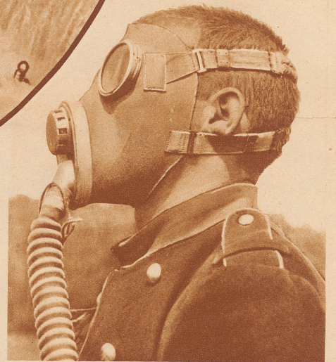
Die Gasmaske für unsere Armee. Im Jahre 1924 wurde in den eidgenössischen Räten der Gasschutz für die Armee beschlossen. In der vergangenen Session des Nationalrates ist jetzt auch ein Kredit von mehreren Millionen Franken für die Anschaffung von Gasmasken für vorläufig einen Teil des Heeres gutgeheissen worden. Unser Bild zeigt das Maskenmodell, das nach langer, sorgfältiger Prüfung für unsere Armee ausgewählt worden ist. Es ist eine Maske, die alle heute bekannten Giftgase zu neutralisieren vermag. Das Stück kostet 40 Franken. Die 400 000 Stück Masken, die etappenweise angeschafft werden sollen, belasten das Militärbudget mit 16 Millionen Franken. Die Handhabung der Maske wird in der gegenwärtigen Infanterie-Rekrutenschule in Zürich erstmals eingeübt