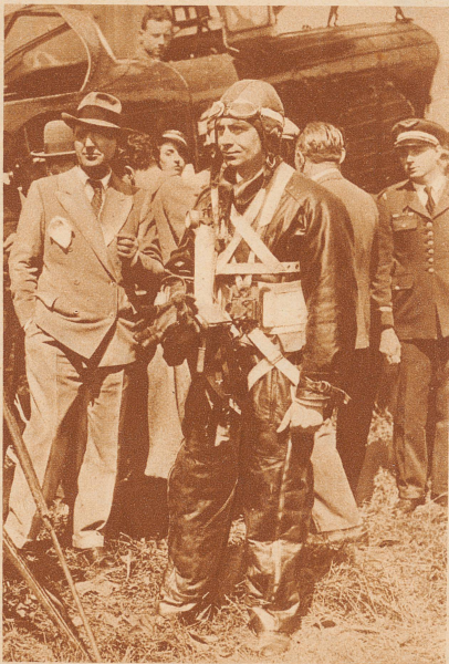
Rekord-Fallschirmsprung. Der französische Fallschirmspringer René Machenaud führte auf dem Flugfelde von Etampes einen Rekordsprung aus 7780 Meter Höhe aus. Diese Höhe zu erreichen, benötigte das Flugzeug 52 Minuten. Der Sprung zur Erde dauerte 23 Minuten. Den bisherigen Rekord hielt mit 7000 Meter der Belgier Coppens