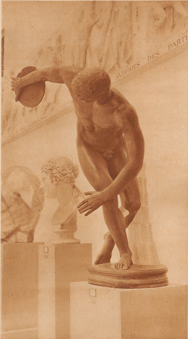
Myrons Diskuswerfer aus dem Jahre 450 v. Chr.