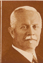
J. O. Frischknecht Zürich 1907—1915 Mitglied und Präsident des technischen Komitees des Eidg. Turnvereins, 1913—1922 Mitglied und Präsident des Zentralkomitees, 1909 bis 1918 Gründer und Präsident des Schweiz. Frauen-Turnverbandes