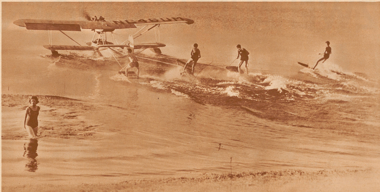
Wellenreiten hinter dem Flugzeug. Ein Flugzeug ist um vieles schneller als ein Motorboot; wer sein Wellenbrett daran hängt und sich ziehen läßt, gleitet in rasender Eile über die Wasseroberfläche und muß sehr geschickt sein, damit es ihn nicht herunterschleudert. Vorläufig kann man so etwas nur ausnahmsweise machen, denn so eine Flugzeug-Wasserfahrt ist eine teure Sache, — aber wer weiß, vielleicht kostet es bald nicht mehr als eine Motorbootfahrt und dann kann man an jedem Sonntag «flugzeugwasserreiten!»