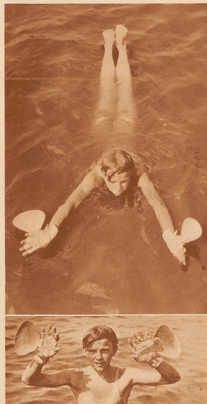
Eine neue Art zu schwimmen: Mit Schwimmhäuten, wie die Ente!

In diesem Sommer gibt es Schwimmhandschuhe, die genau wie die Schwimmhäute wirken, die manche Tiere zwischen den Zehen haben: sie verbreitern die Handflächen, mit denen man auf diese Weise mehr Wasser verdrängen kann; überdies sind an den Handschuhen noch tellerartige Flossen angebracht, ähnlich den Schwimfflossen der Fische. Der Mensch hat sich also das angeeignet, was die Natur den Fischen und den Schwimmvögeln verliehen hat, — er will es eben noch besser können als die Natur. — Aber fein schwimmen kann man mit solchen Handschuhen, das könnt ihr mir glauben, und sogar Nichtschwimmer können sich über Wasser halten.