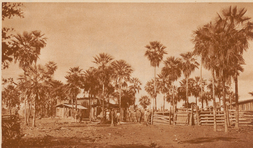
Einer der fünf Sicherungsposten des einzigen Weges, der von Puerto Suarez nach dem vordersten bolivianischen Stützpunkt Vanguardia an der Ostchaco-front führt. Diese Sicherungsposten sind mit ungefähr 50 Soldaten besetzt und liegen in idyllischen Palmenhainen.