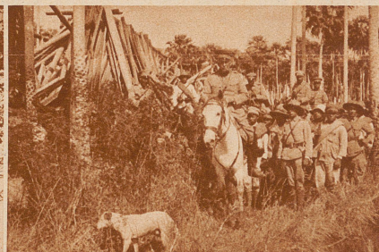
Der von den Paraguayern zerstörte vorderste Posten der Ostchaco-front Vanguardia. Diese kleine kriegerische Aktion, bei der 6 Bolivianer getötet und 23 gefangen wurden, bildete den Anlaß zum letzten Konflikt zwischen Bolivien und Paraguay. Der derzeitige Kriegszustand wurde durch eine ähnliche Aktion, diesmal seitens der Bolivianer, eingeleitet.