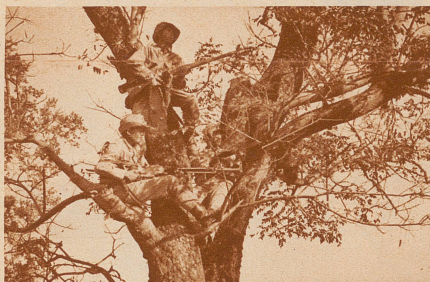
Da der Chaco eine gewaltige, größtenteils mit dichtem Niederwald bewachsene Ebene ohne nennenswerte Erhöhungen ist, werden höhere Bäume als Sandort für die Wachtposten benützt.

Im Hinblick auf diese Tatsachen und Möglichkeiten verliert der Chacokonflikt seine Gefährlichkeit, die man ihm vielerorts glaubt beimessen zu müssen.