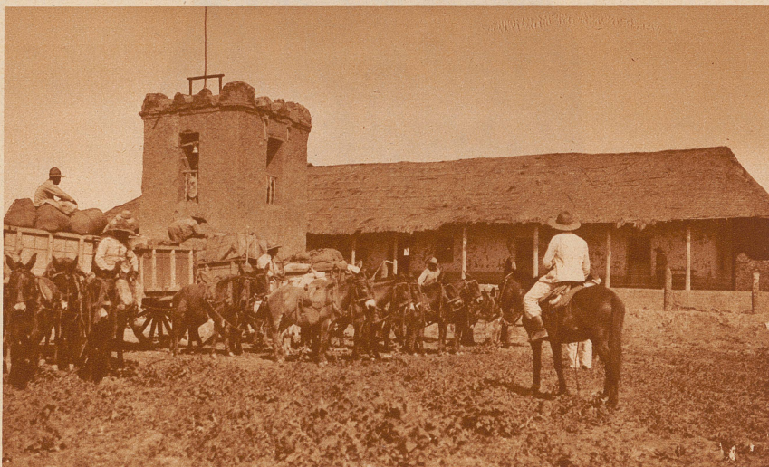
Esteros, der Hauptposten der Bolivianer an der Pilcomayo-front. Im Vordergrund eine abfahrtsbereite Proviant- und Munitionskolonnen. Diese Posten werden Fortin genannt, trotzdem es sich durchwegs um sehr primitive Bauten aus Lehm und Palmenstämmen handelt, die selbst gegen Infanteriegeschosse keinen nennenswerten Schutz bieten.

Text und Bilder vom schweizerischen Fliegerhauptmann Vacano, der während dreier Jahre in Bolivien als Instruktor tätig war, und der infolge seiner zahlreichen Flüge im Chaco einer der besten Kenner dieses Gebietes und der dortigen Verhältnisse ist.