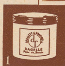
Perfect Cold Cream (Topf oder Tube)