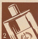
Vivatone (in Flaschen)