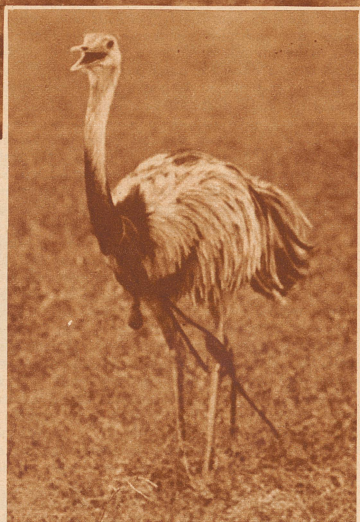
Der Nandu ist gefangen. An Hals und Beinen ist er mit der Boleadora gefesselt und wartet darauf, gerupft zu werden

Mit Windeseile jagt der Nandu über die Pampas, hinterher die verfolgenden Jäger. Ueber ihren Köpfen kreist das Lasso, das im nächsten Augenblick sich um die Beine des Vogels schlingen wird