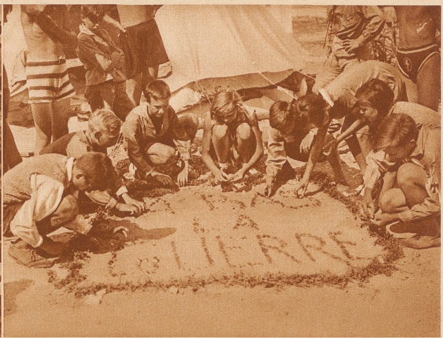
So spielen die Kinder in dem Ferienzelt: Aus kleinen, farbigen Kieselsteinen formen sie im Sand in großen Buchstaben die Worte: «A bas la guerre!» (Man spricht das aus: A ba la gäri!) Das ist französisch und heißt: Nieder mit dem Krieg! Nadher pflanzen sie kleine Wiesenblumen um das Schriftbild und lassen es während der ganzen Ferien stehen

Liebe Kinder, dieses Jahr sind eine ganze Anzahl deutscher Kinder nach Frankreich gegangen und haben zusammen mit französischen Altersgenossen ihre Ferien in einer großen Kinderrepublik in Draveil, in der Nähe von Paris verbracht. Alle Arbeiten, die in so einem Lager zu leisten sind, haben die Kinder selbstständig und ganz allein ausgeführt: Kochen, Wäsche waschen, Ordnung halten, Zelte bauen, den Tag einteilen, Lebensmittel einkaufen. Das freie Leben war natürlich sehr fein, das könnt ihr euch denken, aber wißt ihr, was das Schönste an der ganzen Sache war? Daß die deutschen und französischen Kinder, also die Kinder von Menschen, die vor gar nicht so langer Zeit einen großen Krieg miteinander geführt haben, zusammenleben und sich kennenlernen konnten. Im gemeinsamen Leben haben sie gesehen, daß alles, was sie oft zu Hause gehört hatten, daß nämlich die anderen die Feinde seien, gar nicht wahr war, daß sie alle miteinander Freude an den gleichen Spielen und Liedern hatten, daß sie über die