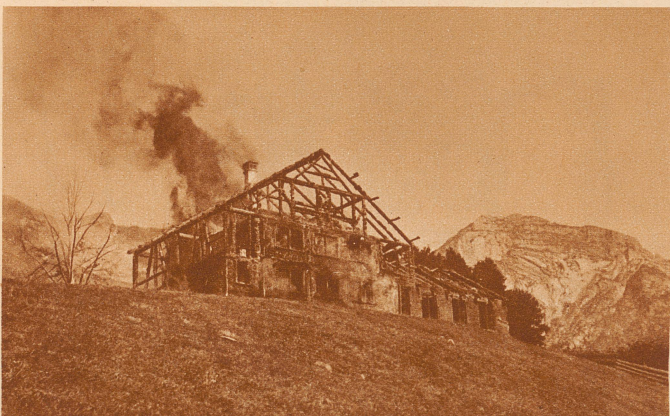
Ein Kinderferienheim brennt! Unlängst brannte um 10 Uhr vormittags in Unterwasser im Toggenburg ein schönes, ganz aus Holz gebautes Kinderferienheim ab. Es ging noch gut ab: Niemand wurde verletzt und auch die Habe der Kinder und ein paar Möbel konnten geborgen werden. Aber die Feuerwehr mußte ihre ganze Kraft aufbieten, um die umliegenden Häuser und Stadel zu schützen. Zur Zeit des Brandes wehte gerade ein starker Wind und brennende Schindeln wurden auf die umliegenden Häuser getragen und gefährdeten auch diese. Das waren aufregende Ferien für die Kinder, die in dem Heim zu Gast waren

Das Ei. «Oh», ruft Hansli beim Frühstück, «mein Ei ist ja faul.» «Gelt, Vati», fragt Annemarie, «das hat ein faules Huhn gelegt?»