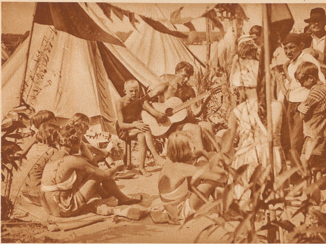
Am Abend in der deutsch-französischen Kinderrepublik: Es wird gesungen und geplaudert in beiden Sprachen; die deutschen und französischen Kinder sprechen über alles, was ihnen nahegeht, vor allem über die Feindschaft zwischen ihren beiden Ländern und wie man da etwas ändern könnte