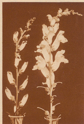
Rechts: normaler Blütenstand der Löwenmaulpflanze. Links: überentwickeltes Löwenmaul als Folge der Bestrahlung der Mutterpflanze durch Röntgenstrahlen