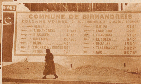
Wegweiser am Rande der Sahara. Er zeigt mit phantastischen Kilometerzahlen die kürzeste und einzige Route vom Mittelmeer durch die sonnenbesprühte Sahara in das Herz Afrikas an

Bei der halbversandeten Wasserstelle Hassi el Khrenig, 200 Kilometer von der Oase In Salah durch eine gefährdete und vollständig wasserlose Wüstenstrecke entfernt, begegnete ich zum erstenmal dem Wüstenpostreiter, der die Briefschaften der französischen Militärposten im Hoggar, in einem 750 Kilometer langen und ununterbrochenen Gewaltmarsch von zwölf Tagen nach der Postablage In Salah bringt. Mit schnellen, elastischen Schritten und sich frauenhaft in den Hüften wiegend, wanderte er mit seinem alabasterfarbenen Mehari (Reitdromedar) an unserer Karawane vorüber, so rasch, daß