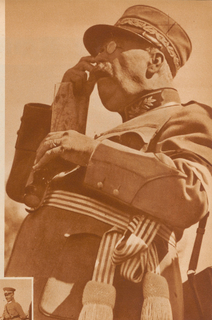
Oberstkorpskommandant Biberstein, der Majorverwalter