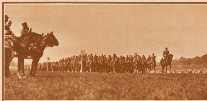
Die Kavallerie-Brigade 3 defiliert im Trüb. Als der Spitze der Brigade reitet ein hantelender Standarte die Fahnenwache.