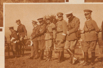
Die fremden Offiziere