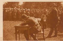
Bundesrat Meyer und Oberstkorpskommandant Biberstein bei der Manöverbesprechung