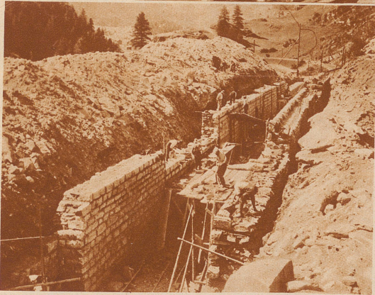
Der werdende Tunnel