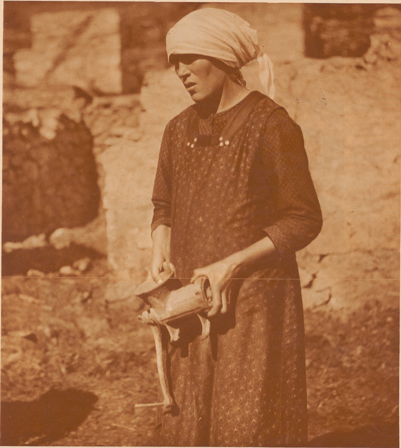
Das Ueberbleibsel. Diese Fleischmaschine ist das Einzige, was die Frau aus dem Feuer retten konnte. In ihrem Trostverlangen klammert sie sich an dieses eine Stück und ist froh, daß sie noch irgend etwas in Händen halten darf, das aus dem zerstörten Heime stammt.