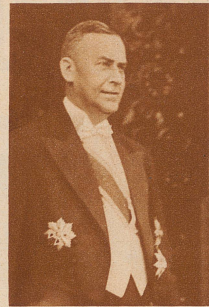
Minister Künzl-Jizerski, der neue Gesandte der Tschechoslowakei in Bern.