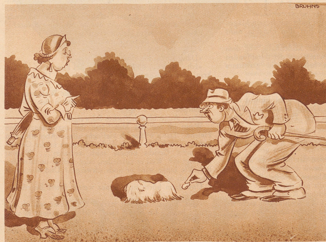
Das neue Hündchen. «Aber, Oskar! Das ist ja das verkehrte Ende!»

deiner Nähe einen kalten Zigarrenstummel im Mund?» «Nicht im mindesten Schatz.»