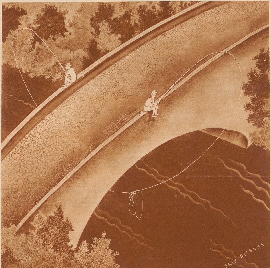
Die beiden Angler zugleich: «Aha, es beißt an!»

«Nein, absolut nicht. Ich sehe ausgezeichnet.» «Sitzest du nicht in Zugluft? Hat niemand in