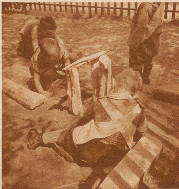
«Hier fließt Strom», sagt der Kleine, nachdem er einen hölzernen Draht über die zwei eingemauerten Telefonstangen gelegt hat

Wenn wir Erwachsenen uns Zeit zum Nachdenken einräumen wollten, dann würden wir in diesem Gärtli wohl den Schlüssel finden, der uns ab und zu Einlaß verschafft in ein verlorenes Paradies, in eine Welt, worin wir tröstliches Kinderglück und freundlich-gute Beschwichtigung seit langem unterdrückter Wünsche erfahren. Vielleicht sogar ginge uns in dieser Welt ein Licht über die Notwendigkeit der Kunst und die so wichtige Aufgabe der Dichter, der Maler und auch der Musiker auf.