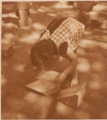
Wenn man die Klötze richtig aneinanderrückt, entsteht ein feiner Liegestuhl. Von Härte keine Spur, herrlich bequem kann man sich hier ausstrecken, so recht wie eine Dame!