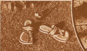
Entscheidend gemacht und gefahren sind einfruchtliche Sande