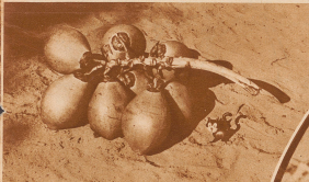
Die Kinnigokopplente bringt die schönsten Früchte ihrer Gattung hervor. Die prächtigen, wie die Beeren einer Traube aus dem Stiel aufgehängten Nüsse liegen im Uferlande eines europäischen Fräses. Der eingeborene Träger hat sie auf den Boden gelegt, da er ein Weibchen auf die Fährte zu warten hat, die mit leuchtenden Bänderklängen zum anderen Ufer rufen