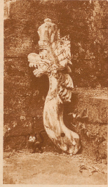
Die Tropen sind heiß und furchbar zu glücklichen Tagen voll Sonnenschein und Sonnenschein. Die halboffene Kasse setzt im Zeitstempel bei Singa Kadja zeigt in ein warmes verregnetes Löwenhaupt