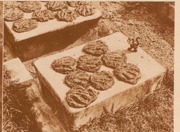
Und dabei belagerten Schwerekränker, man begriffe die Ween dieses einseitigen Landes erst, wenn man seine heiligen Steine gesehen habe. Wie sind in einem Dorf bei Kultura. Die Sonne schwebt. Eine schwarze eingeborene Frau umringter Kette hat den Daug heiliger Kette mit den Händen zu Kupfen gefüllt und so schwebend zum Trostern auf abwärtsliche Sitzen gelassen. Die Freigedanken sind deutlich erkennbar. Eingegen allen europäischen Erwänden von Hygiene wird dieser getrocknete Daug der als heilig verehrte Kalle aus wehrlosen Kaugewürzen von Fäulnis und als wehrlosige Medizin verwendet