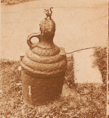
Frucht in Java! Ein Bild, wie wir es aus für Europa noch besser denken könnten! - Die einwärts geführten barocken Kanonen sind nur Kalle gekommen und haben hier in Batavia eine zweckmäßige Verwendung als Sandsperrmittel gefunden!