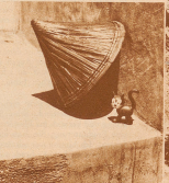
Wie der Tropenherbst ausstirbt, sind wir im Gebiet der heißen Gürtel der Erde. Selbst die eingeborenen auf Calben verhalten eine Kuchenschöpfung nach. Dieser prächtige gebohrte Kugelstein misst rasch gegen Sonne und Regen