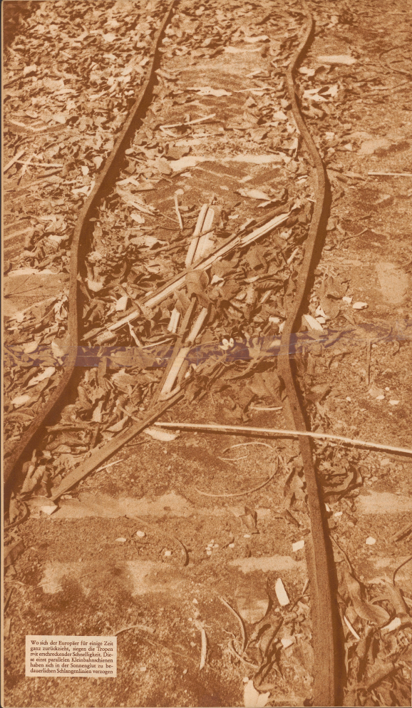
Wo sich der Europäer für einige Zeit ganz zurückzieht, sorgen die Tropen mit endloser Schönheit. Die in einer paradiesischen Kleinstadt haben sich in der Sonne gelagert, bis die dazwischen Schlangennetze vertragen