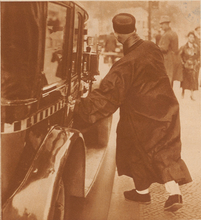
Der Mann, dessen Bilder in sämtlichen Zeitungen Europas unzählige Male erschienen sind, flüchtet vor einem Photoreporter in ein rettendes Taxi

Lincoln-Treibtsch, der große Unruhestifter, eine der mysteriösesten Figuren unserer Zeit, dessen Leben Stoff für zehn Romane gäbe, ist wieder aufgetaucht; diesmal unter dem Namen Chao Kung und in Gewand und Kappe eines buddhistischen Priesters, denn er lebt seit Jahren in einem tibetischen Kloster, wo er, der ungarische Rabbinssohn, zu den höchsten religiösen Weihen aufgestiegen ist, wie Reisende berichten. Nun ist er plötzlich wieder in Berlin, was vielen von böser Vorbedeutung erscheint, denn es gibt kaum eine Revolution der letzten Jahrzehnte, bei der dieser «Sturmvogel Europas» nicht helfend und vorbereitend mitgewirkt hätte. Vorläufig widmet er sich chinesisch-philologischen Studien und hält in der buddhistischen Gemeinde Berlins Vorträge über seine innere Wandlung! In den Straßen der Stadt wurde er trotz seiner fremden Tracht von einem Photoreporter erkannt, der sofort mit seinem Apparat Jagd auf ihn machte, bis sich das Opfer durch Flucht in ein Taxi den Gefahren der Publizität entzog, — aber schon war es zu spät!