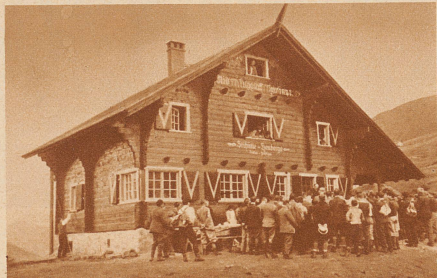
Die Skihütte der Sektion Prätigau des S. A. C. Sie liegt auf 1950 m Höhe in den Heubergen, 3 Stunden ob Fideris, ist zweistöckig, hat 64 Schlafplätze, Zentralheizung und fließendes Wasser. Mit ihr ist ein Gelände mit prächtigen Tourenmöglichkeiten erschlossen.