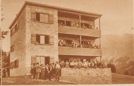
Die neuerstellte Jugendherberge der Genossenschaft der Zürcher Jugendherbergen am Fuße des Stätzerhorns bei Lenzrheide. Das Heim bietet Übernachtungsgelegenheit für 70 Jugendliche und gutausgedachte hygienische Einrichtungen ermöglichen auch längere Aufenthalte, z. B. die Beherbergung von Ferienlagern.