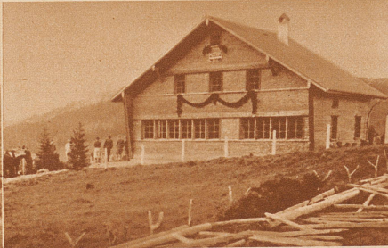
Die neue S. A. C.-Hütte der Sektion Säntis auf der Kammhalde zwischen Potersalp und Schwägälp. Sie wurde am 9. Oktober eingeweiht.