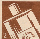
2 Vivatone (in Flaschen)