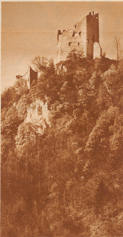
Die Burgruine Pfefingen

Nein — es wird nicht zu machen sein. Er muß sich wohl oder übel auf eine neue Lüge besinnen, um sich aus der selbstgestellten Falle herauszubringen. Er drehselt kluge Worte zusammen, die ihm freilich schon wäh-