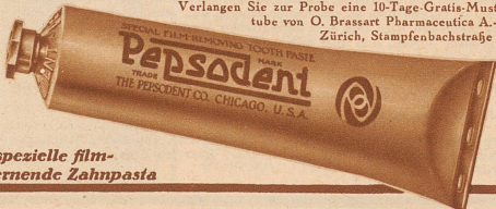
Die spezielle film-entfernende Zahnpasta

Verlangen Sie zur Probe eine 10-Tage-Gratis-Mustertube von O. Brassart Pharmaceutica A.-G., Zürich, Stampfenbachstraße 75.