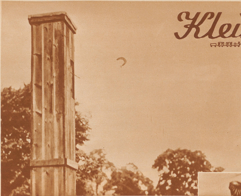
Das ist der Fisch-Automat: soeben hat jemand einen Zwanziger eingeworfen, das Hupensignal hat ertönt und in hohem Bogen kommt ein Fischlein durch die Luft geflogen. Unten im Wasser . . . .

mat ein Fischlein heraus, wird in hohem Bogen durch die Luft geschleudert und landet direkt in einem begeisterten Seelöwenmaul, — und gleich darauf noch einmal und noch einmal: drei Fische gibt es für einen Zwanziger! Oft machen die Tiere die kühnsten Kunststücke, um die Fische im Flug aus der Luft zu erhaschen und wer am geschicktesten ist, bekommt die meisten Fische zu schlucken. Die Kinder jubeln, weil das alles so lustig ist. Die Seelöwen verhalten sich nach vollzogenem Mahl still und würdevoll und nehmen von den vielen Menschen keine Notiz mehr, bis . . . das Horn zum nächstenmal ertönt und die ganze Aufregung von vorn beginnt. So haben die kleinen Menschen und die großen Tiere ihre Freude!