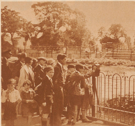
Das Becken der Seelöwen. Der kleine Kasten am Gitter vorn ist der Einwurf, in den man seinen Zwanziger hereinstecken muß, um die Seelöwen durch den Fischautomaten zu füttern. Den großen Automatenkasten, aus dem dann die Fische herausgeschleudert werden, sieht man hier nicht, er steht auf einer kleinen Felsinsel in der Mitte vom Becken. Vorn auf dem großen Schild steht auf englisch: «Wer die Seelöwen füttern möchte, soll ein Zwanzigrappenstück in den Einwurf stecken.»

. . . sperren schon die Seelöwen ihre ewig hungrigen Mäuler auf, um die Spende zu erhaschen. Oft tun die schweren Tiere einen großen Gump in die Luft oder vollbringen ganze Kletterkunststücke, um einer dem andern zuvorkommen. Das ist dann für die Kinder, die zuschauen, das schönste von der ganzen Fütterung.