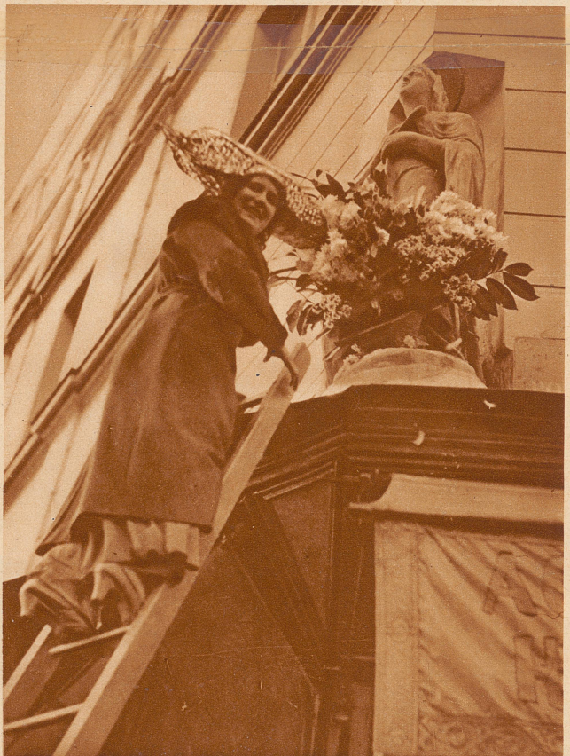
Das fröhliche Fest der Heiligen Katharina in Paris. La Sainte Cathérine, der 25. November, ist der Tag der Midinettes, der kleinen Modearbeiterinnen, die über 25jährig und noch nicht verheiratet sind. Sie begehen ihn als Fest, - nicht als Trauertag und Paris gehört für diesen einen Tag ihnen, ihren Umzügen und Maskeraden. - Bild: Eine Cathérinette mit der charakteristischen Flügelhaube bekränzt die Statue ihrer Schutzheiligen, die mitten in der Stadt Paris an einer belebten Straßenkreuzung in einer Hausnische steht

Seit mehr als fünf Jahren lebte Trotzki auf der kleinen türkischen Insel Prinkipo im Marmarameer in Verbannung. Mehrere Versuche seinerseits, während den fünf Jahren in einem west-