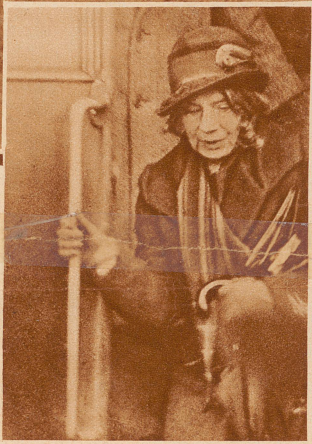
Frau Trotzki verläßt den Zug in Dünkirchen