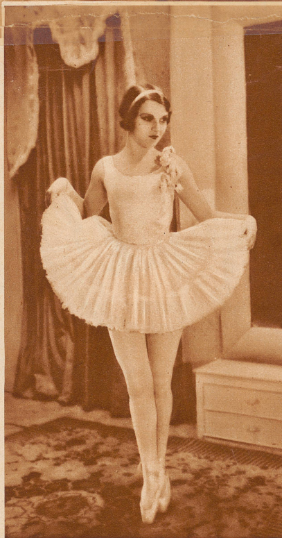
in «Le Million»

Durch die Filme des großen französischen Regisseurs René Clair geht die Gestalt eines jungen Mädchens von besonderer Feinheit und etwas exotischer, sehr stiller Anmut, eines Mädchens, das alle bezaubert, die sie einmal sahen, trotzdem es durchaus keine Filmschönheit im üblichen Sinn ist: Die Annabella. Auch in dem letzten René Clair-Film, der wieder ein kleines Menschenschicksal aus der großen Stadt Paris zum Thema hat, spielt sie die Hauptrolle. Jeder, der Annabella, die Zarte, liebt, möchte ihr wünschen, daß sie noch lange unter der behutsamen Leitung René Clairs arbeiten könne und daß sie es nicht nötig haben möge, sich in den gewöhnlichen Filmbetrieb einzufügen und zu vergrößern.