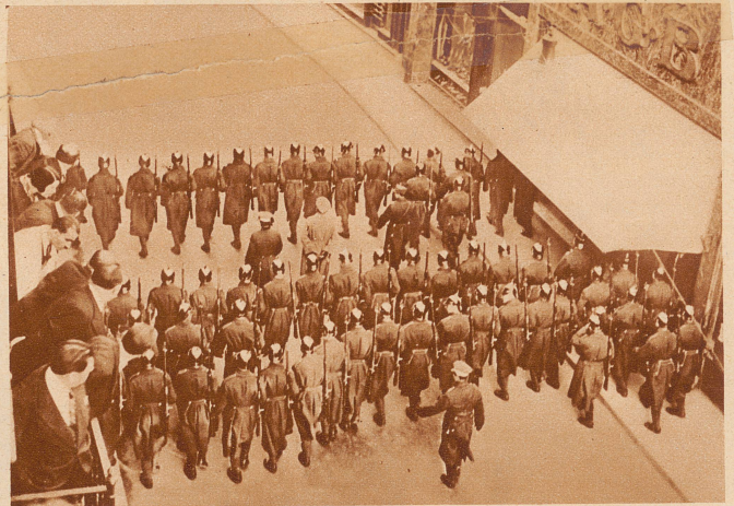
in Bukarest: Die National-Liberalen, die in Opposition zur jetzigen rumänischen Regierung stehen, demonstrierten in den Straßen der Hauptstadt; als die Demonstranten bis zum königlichen Schloß vordringen wollten, ging Polizei und Gendarmerie vor und riegelte sämtliche Zugangsstraßen ab (Bild), wobei es zu heftigen Zusammenstößen kam