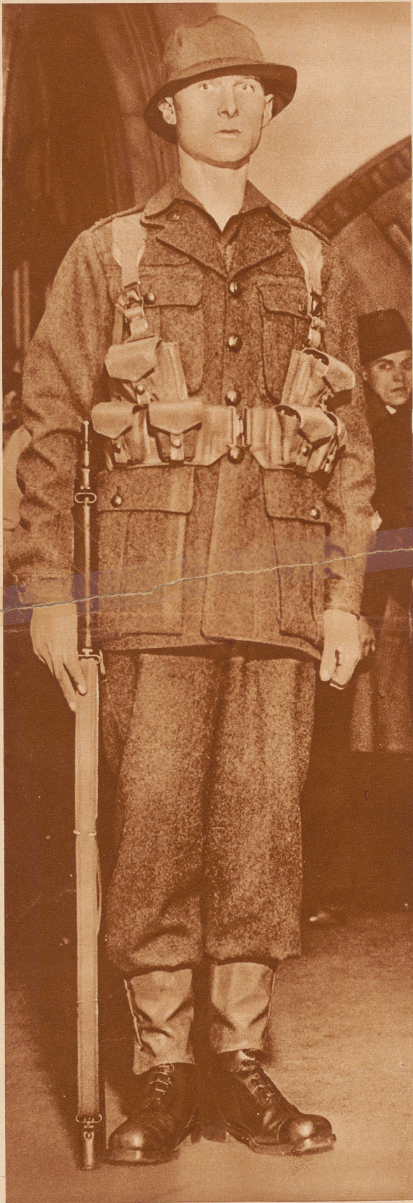
Die neue Uniform der englischen Infanteristen. In Scotland Yard fand in diesen Tagen unter Ausschluß der Öffentlichkeit eine große «Modeschau» zum Zwecke der Neuniformierung des britischen Landheeres statt. Für jede einzelne Waffengattung wurden eine ganze Anzahl Uniformtypen den Sachverständigen vorgeführt. Unser Bild zeigt die neue Uniform, die für den englischen Infanteriesoldaten als am zweckmäßigsten befunden und angenommen wurde.