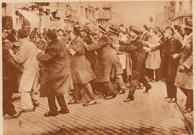
in Sofia: Die nationalen Studenten demonstrierten gegen den Friedensvertrag von Neuilly; als die Polizei gegen sie vorging, kam es zu schweren Tötlichkeiten. — Bild: Die Polizei versucht ohne Erfolg, die Demonstranten auseinanderzutreiben