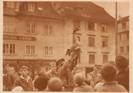
Ein Draht wird über die Straße gespannt und daran die tote Martinigans aufgehängt. Diesmal ist es eine buntscheckige, während man sonst immer eine schneeweiße nahm

eine tote. Die Polizei, die auch dabei sein wollte, sperrte den Platz ab, damit kein Auto in die vielen, vielen Kinder und in die tote Gans fuhr. Plötzlich widerhallte das Städtchen von Trommelwirbeln. Die Kinder jauchzten: «Sie kommen, sie kommen!» Und wirklich, was ist das auch für ein Bögg zwischen den beiden roten Trommlern? Er hat eine riesige Sonnenlarve über den Kopf gestülpt und schwingt einen krummen Säbel in der Faust. Wehe dir Gans! Jetzt geht es dir an den Krage! Aber nicht so rasch! Dem grausamen Mann mit dem Säbel haben sie die Augen verbunden. Und nun wirbeln sie ihn auch noch zwei-, dreimal herum, bis er endlich auf den Draht stößt und mit einem Hieb die Gans vom Draht haut. Aber das geht auch nicht so leicht. Die Gans ist zäh und der Krummsäbel haut nicht. Drei, vier, fünf