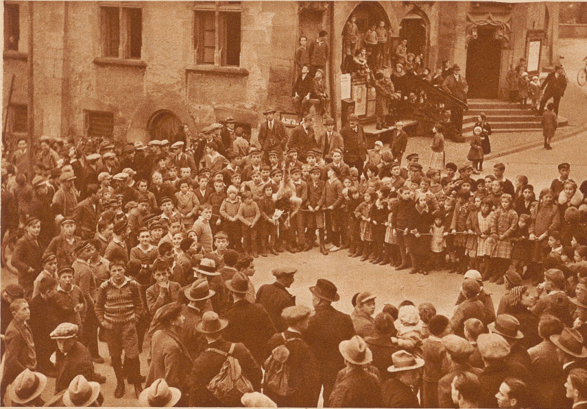
Während der «Gans-Abehauer» mit verbundenen Augen durch das Städtchen irrt, stehen die Kinder ungeduldig wartend um die Gans

Liebe Kinder, der Unggle Redakter hat wieder einmal ein Reischen gemacht, um euch einige interessante Bilder mitzubringen. Am liebsten hätte er einen ganzen Haufen Kinder, alle Leser der Kindersseite mitgenommen. Denn, selber dabei sein, ist immer schöner, als nur die Bilder davon zu sehen, nicht wahr? Nun also, euer Unggle ist die letzte Woche nach Sursee an den Sempachersee gefahren. Bloß wegen einer Gans! Ihr werdet lachen. Gänse gibt's doch überall, da muß man nicht extra mit der Eisenbahn hinreisen. In Sursee war aber etwas besonderes mit einer Martinigans los. Ihr wißt vielleicht, daß man an vielen Orten an Martini, am Namenstag Martins, Gänsebraten ißt. Ein böser Tag für die armen Schnatteriche! In Sursee ist nun ein Brauch mit diesem Gänse-Essen verbunden, den schon die Urgroßväter und -Mütter der Surseer Kinder gekannt haben. Und das ist doch gewiß schon lange her. — Als der Unggle Redakter glücklich und neugierig auf dem Rathausplatz in Sursee stand, da spannten sie gerade einen Draht über die Straße und hängten eine fette Gans daran, keine lebende, sondern