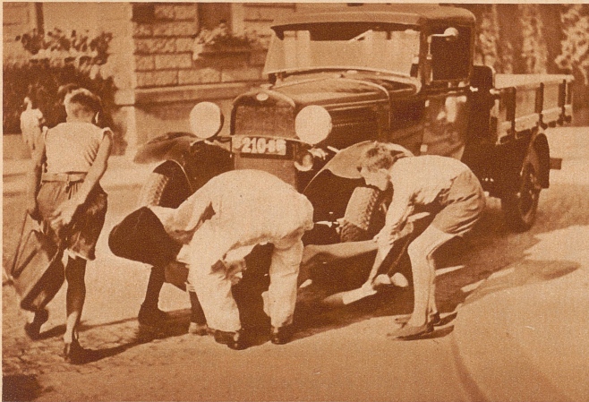
Ist etwas passiert? Ja, ein Knabe hat beim Überqueren der Straße nach der falschen Seite gesehen und ist unter ein Auto geraten. Vorübergehende und der Autoführer holen ihn schnell unter dem Wagen hervor und — —