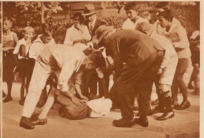
— — — leisten ihm die erste Hilfe, bis der Arzt kommt, um festzustellen, ob der Arme ins Krankenhaus muß oder ob es nur äußere Verletzungen gegeben hat