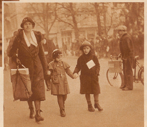
Hier ist eines der 250 Kinder mit seiner neuen Mutter. Die Frau hat gleich ihr eigenes Kind mitgebracht, damit das österreichische sich nicht fremd fühlen sollte. Jetzt gehen sie Hand in Hand durch die Straßen nach Hause und werden bald gute Freunde sein. Das Steyrerkind ist das mit dem weißen Karton um den Hals