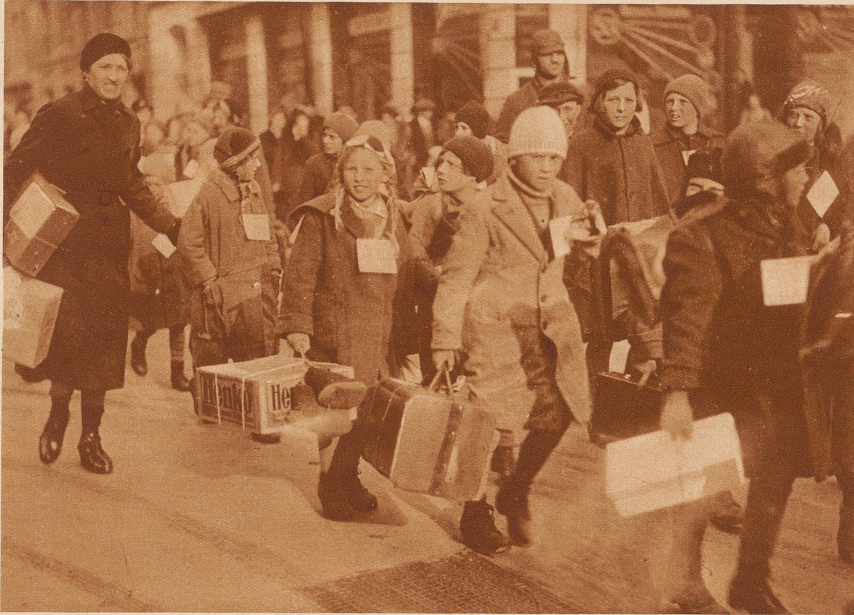
Die Steyrer Kinder ziehen mit Sack und Pack vom Zürcher Bahnhof zu dem Schulhaus, in dem sie ihre Pflege-Eltern treffen sollen. Manche haben Rucksäcke, andere Kartons und Pappschachteln, worin sie ihre Sachen verstaut haben. Das Mädchen vorne hat seine Filzfnken außen an die Schachtel gebunden. Alle sind müde von der weiten Reise und begucken sich erstaunt die fremde Stadt