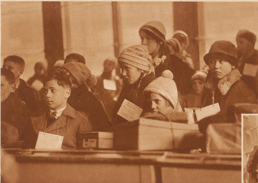
Im Schulhaus wurden die Kinder auf die verschiedenen Klassenzimmer verteilt und warteten, bis ihre Nummer aufgerufen wurde und die Pflegemutter sie in Empfang nahm. Es waren 250 Kinder und da ging es natürlich lange, bis jedes drangekommen war. Einige bekamen beim Warten ein bißchen Heimweh und weinten, besonders die Kleinsten; dann kamen die Größeren und trösteten sie