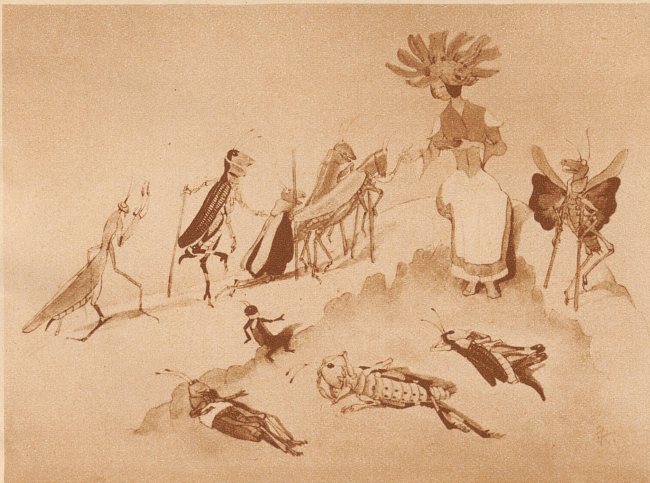
Frau Arnika pflegt die kranken Tiere (Aus «Bergblumen»)

Es gibt unter den heute Erwachsenen Unzähliche, deren Kindheitshimmel bevölkert war von den lieblichen und lustigen, den halb irdischen, halb zauberhaften Wesen der Kreidolfschen Welt. Dazumal wie heute leben die Kinder beglückt mit Frau Bohne und Frau Erbse, mit der schönen Frau Georgine und ihren Kindern, mit Herrn Schlüsselblum und Frau, mit den diebischen Nachtschattengewächsen und mit den geliebten Wiesenzwergen. Daß das keine gewöhnlichen vergänglichen Bilderbücher, sondern die Werke eines großen Künstlers sind, wußten die Kinder noch nicht. Die inzwischen Herangewachsenen aber wissen es und werden am 9. Februar dankbar des Siebzigjährigen gedenken.