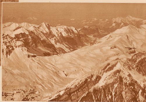
Unterweg in der Gegend des Klammens. Rechts das Schöpferflugzeug, links der Segler. Darzwischen liegen die 140m Verbindungsseil.

Dem bekannten Schweizer Segelflieger W. Farner und dem Sportflieger R. Fretz gelang am 13. Februar die erste Transversierung des Zentralalpenmassivs von Zürich nach Mailand im Schöpferflug. Die beiden Piloten starteten um 14 Uhr 45 in Dübendorf, wählten die Route über Rapperswil—Einsiedeln—Pragelbach—Lukmanier—Bellinzona—Como und landeten glatt. Fretz um 16 Uhr 48, Farner um 17 Uhr 02, auf dem Flugfeld Tabbaco bei Mailand. Die maximale Höhe von 3200 m erreichten sie über dem Lukmanier. In dem Segelflugzeug wurden 51 kg Post mitgeführt. Der Rückflug soll von Mailand nach Avona unternommen werden.