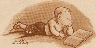
Mädchen liest: «Sie hatte Augen wie Sterne und Lippen wie Blütenknospen ...»