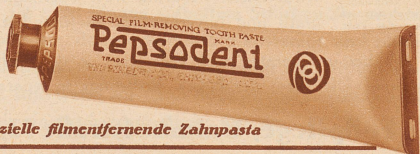
Die spezielle filmentfernende Zahnpasta

Verlangen Sie ein Gratismuster von O. Brassart Pharmaceutica A.-G., Zürich, Stampfenbadstraße 75