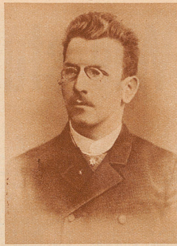
Dr. med. Bircher-Benner,