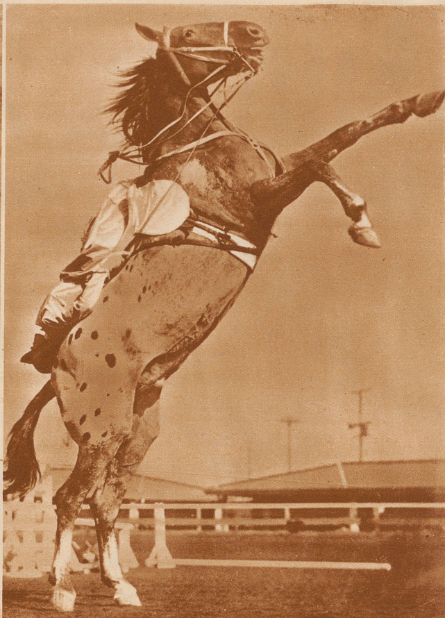
Vorführung einer amerikanischen Kunstreiterin bei einer Konkurrenz in Los Angeles