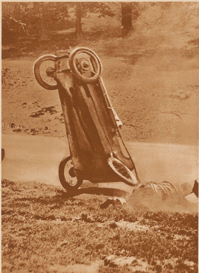
Zwischenfall bei einem englischen Autorennen an einer scharfen Kurve. Rechts neben dem Wagen der herausgeschleuderte Fahrer, der mit dem Leben davonkam