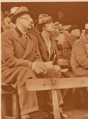
Auf der Tribüne