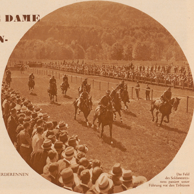
AUFNAHMEN VON DEN ZÜRCHER PFERDERENNEN