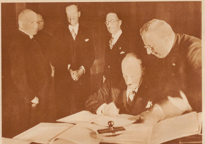
Ein wichtiges politisches Ereignis: Das Zustandekommen des Viererpaktes zwischen Deutschland, England, Frankreich, Italien. Unsere Aufnahme zeigt den historischen Moment der Unterzeichnung des Vertrages in Rom: Links Mussolini, rechts von ihm der deutsche Botschafter von Hassel, sitzend der französische Botschafter Jouvenel beim Unterschreiben