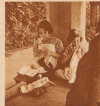
Grassilla ist kein Kind mehr, aber auch sie teilt sich ein Buch zur Unterhaltung aus, wenn sie mit ihrem Schwesterchen und einer Handarbeit in den Park von Retiro kommt