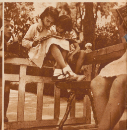
Das muß ja etwas ganz Spannendes sein