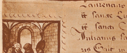
Ein seltenes Dokument aus dem Zürcher Staatsarchiv: Die Initial-Miniatur eines Ablassbriefes.

Sechzehn römische Kardinäle erteilen der Liebfrauenkapelle im Pflasterbach bei Regensburg Ablass. Die schönen Miniaturen in kunstvoller Zeichnung und leuchtenden Farben dürften von einem süddeutschen Maler stammen